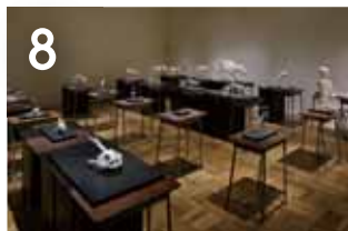
8 생명의 형태 여기는 척추동물들의 교실. 흑판의 좌석표를 보면서 출석확인을 해봐요. 대답은 하지 않았지만...