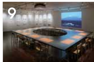
9 후지노쿠니와 지구 지구 가족 회의 테이블을 둘러싸서 우리들이 살고 있는 후지노쿠니와 지구의 "7+1 환경리스크"를 알아봐요.