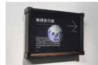
11 지구사의 여행 전시실을 지나는 200m의 복도를 46억년의 지구사에 비유하여, 이제까지 지구 상에서 일어난 사건을 17개의 표본상자에 넣었습니다.