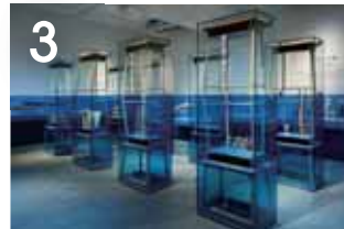
3 후지노쿠니의 바다 일본에서 가장 깊은 만인 스루가 만이 있는 후지노쿠니의 바다에는 다양한 수생생물이 살며, 풍요로운 바다의 진미를 공급해 줍니다.