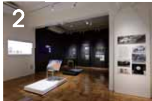
2 후지노쿠니의 모습 무료 후지노쿠니의 자연은 우리들의 삶에 풍요로운 혜택을 주는 반면에, 때로는 위협이 되어 평온한 일상을 빼앗아 갑니다.