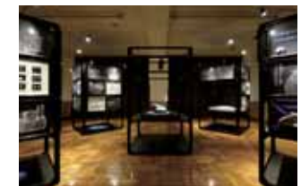
12 기획전시실 뮤지엄이 주최하는 기획전의 전시장으로 사용됩니다. (내용에 따라, 별도 관람료를 받는 경우가 있습니다.)