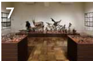
7 후지노쿠니의 다양한 생물 후지노쿠니의 변화무쌍한 자연환경에서 자라는 다양한 생물들을 본 박물관이 수집한 많은 표본을 통해서 소개합니다.