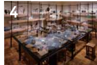
4 후지노쿠니의 대지 여러 생물은 '먹고-먹히는' 먹이사슬로 연결되어 있습니다. 우리들 인간도 예외가 아닙니다.