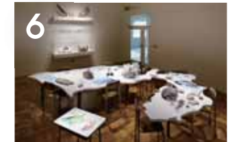
6 후지노쿠니가 만들어지는 과정 현재 각지에서 산출하는 암석과 광석, 그리고 화석이 후지노쿠니가 만들어지는 과정과 오랫동안의 자연과 생물의 존재를 이야기합니다.