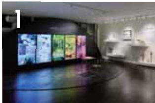
1 지구환경사와의 만남 무료 지구환경사란 무엇인가? 바다와 대지에 새겨진 기록은 인간과 자연의 역사를 전하고, 미래를 비추는 이정표가 됩니다.