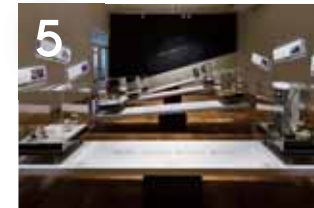
5 후지노쿠니의 환경사 조몬시대부터 현대에 이르는 역사 속에서 후지노쿠니에 사는 인간과 자연의 관계는 어떤 변화를 해 왔을까요?